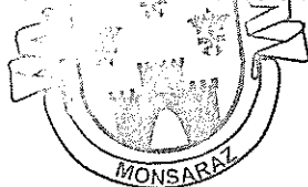
(Nuno Isidro de Ambrósio Pinto)